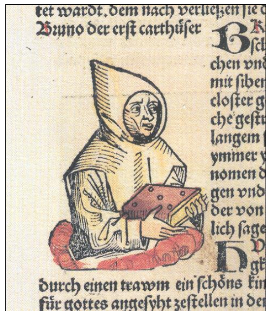
Bruno, detail uit blad CXCI van de Duitse versie van Schedels Wereldkroniek, in 1493 te Neuremberg gedrukt.

Hartmann Schedel was een arts uit Neuremberg, die aan het eind van de vijftiende eeuw het plan opvatte om een kroniek aan te leggen vanaf de stichting van de wereld tot aan zijn eigen tijd. In die kroniek, die in 1493 in twee versies (een in het Latijn en een in het Duits) te Neuremberg werd gedrukt, beschrijft hij ook kort de stichting van de kartuizer orde en degenen die daar direct bij betrokken waren, te weten Bruno en Hugo van Grenoble.