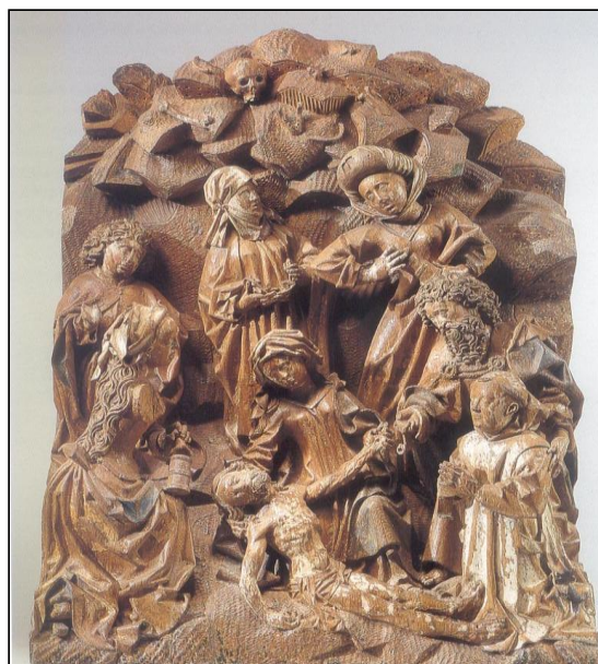
Dit fraaie retabel, rond 1480 gesneden door Meester Arnt Beeldesnider van Kalkar voor het Roermondse kartuizerklooster, zal in de tentoonstelling te zien zijn.

In haar vergadering van 26 november jongstleden besloot het stichtingsbestuur van Stichting De Roermondse Kartuizers na rijp beraad en in goed overleg met verschillende direct belanghebbenden tot uitstel van de tentoonstelling 'Het geheim van de stilte. De besloten wereld van de Roermondse kartuizers'. Wat is nu de reden van dit uitstel? Deze ligt in het feit dat enkele weken daarvoor een tweetal belangrijke buitenlandse instituten tot hun grote spijt geen toestemming konden verlenen voor de bruikleen van twee belangrijke topstukken, die zeker een plaats in de Roermondse tentoonstelling verdienen. In de laatste onderhandelingsfase werd duidelijk dat, hoewel men in beide gevallen zeer positief ten opzichte van het project en het bruikleenverzoek stond, de toestand van de gevraagde bruiklenen een reis naar Roermond in de huidige staat niet mogelijk maakte. Het risico op ernstige schade tijdens het transport was te groot. Men kon dan ook enkel bruikleen toestaan wanneer de stukken eerst geconserveerd zouden worden.